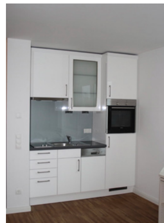
Jedes Appartement hat eine Küchenzeile mit Geschirrpülmaschine

sind zwischen 25 und 28 Quadratmetern groß und mit einer Küchenzeile inklusive Geschirrpülmaschine, großen Schreibtischen, Fußbodenheizung und vielen weiteren Extras ausgestattet. Auf jeder Etage befinden sich zudem eine Waschmaschine und ein Trockner zur kostenfreien Nutzung. Bei der Planung des Hauses hat der Bauträger HBI mit dem Buxtehuder Architekturbüro Frenzel und Frenzel zusammengearbeitet. Für die Ausstattung der Appartements hat