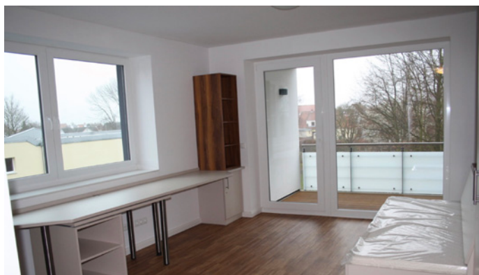
Die Appartements verfügen u.a. über große Schreibtische, sind mit einem Plankenbelag in Holzdekor ausgestattet und haben teilweise einen Balkon