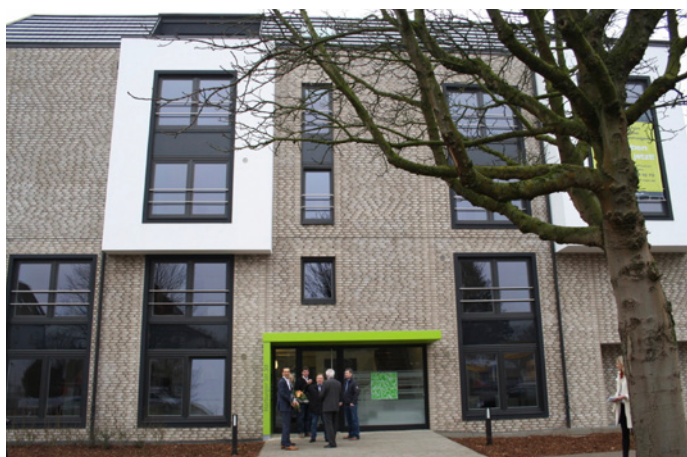
Schon von außen ein Hingucker: bei der Planung des Studentenheims hat die Bauträgerfirma HBI mit dem Architekturbüro Frenzel und Frenzel zusammen gearbeitet